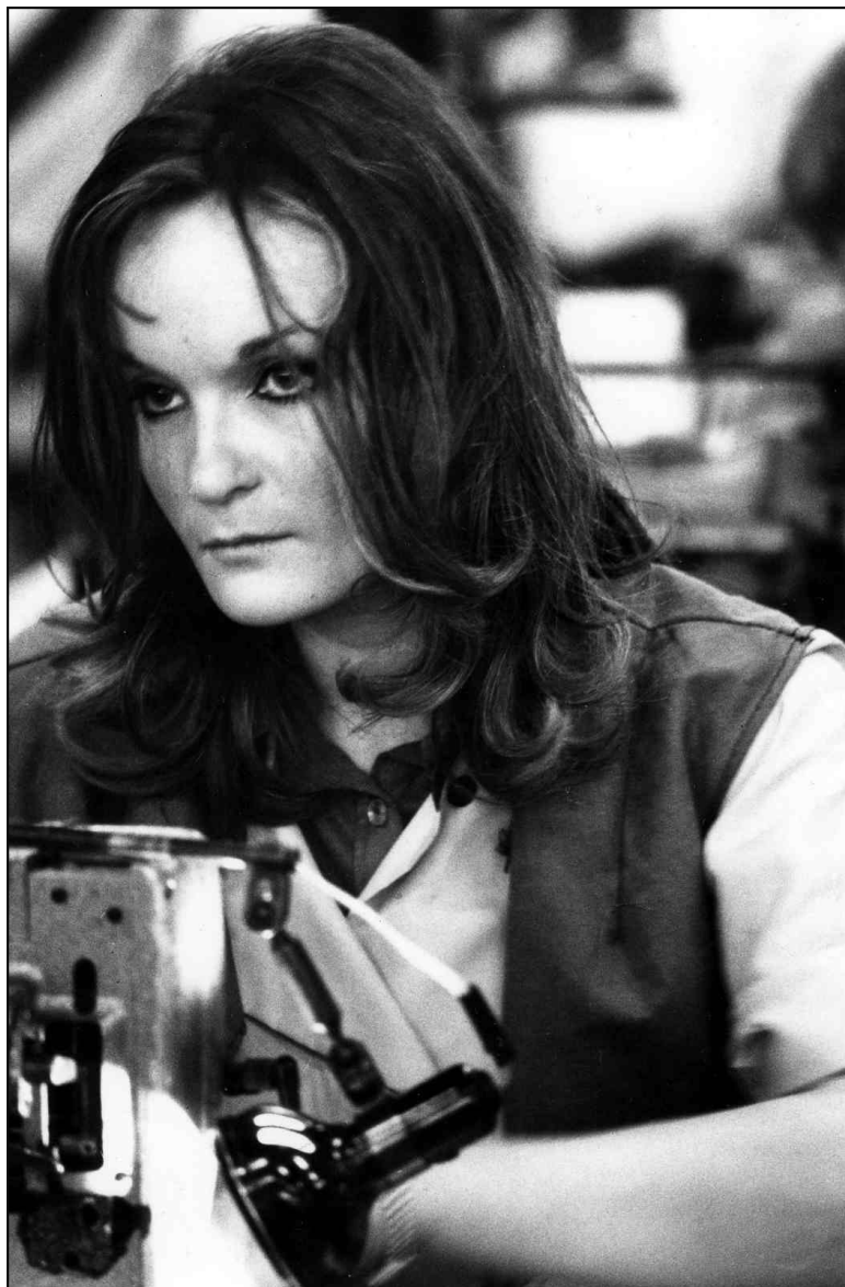
Ouvrière, usine Renault, Sandouville, 1970