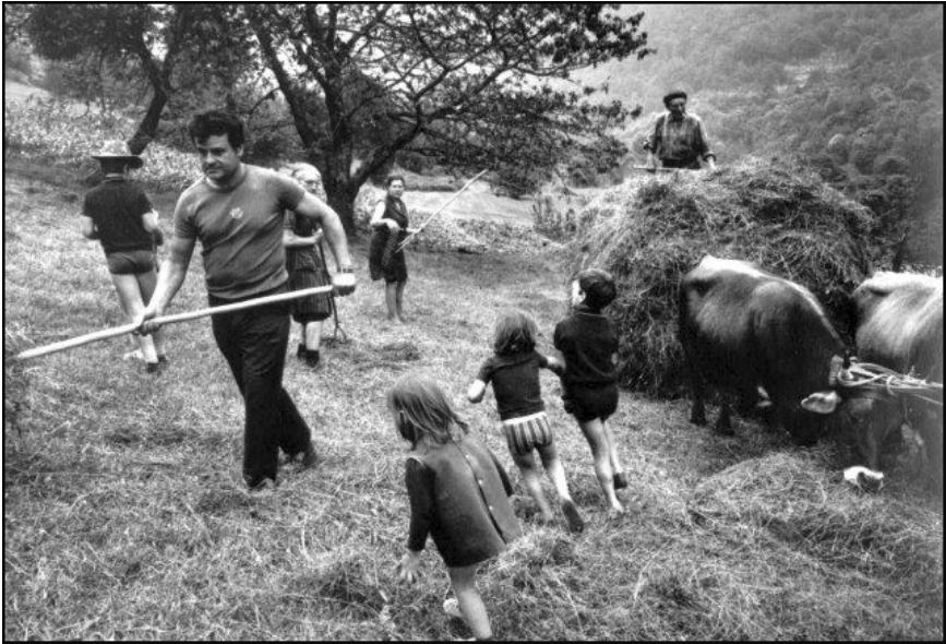
Paysans, Mesles, Hautes Pyrénées, 1972