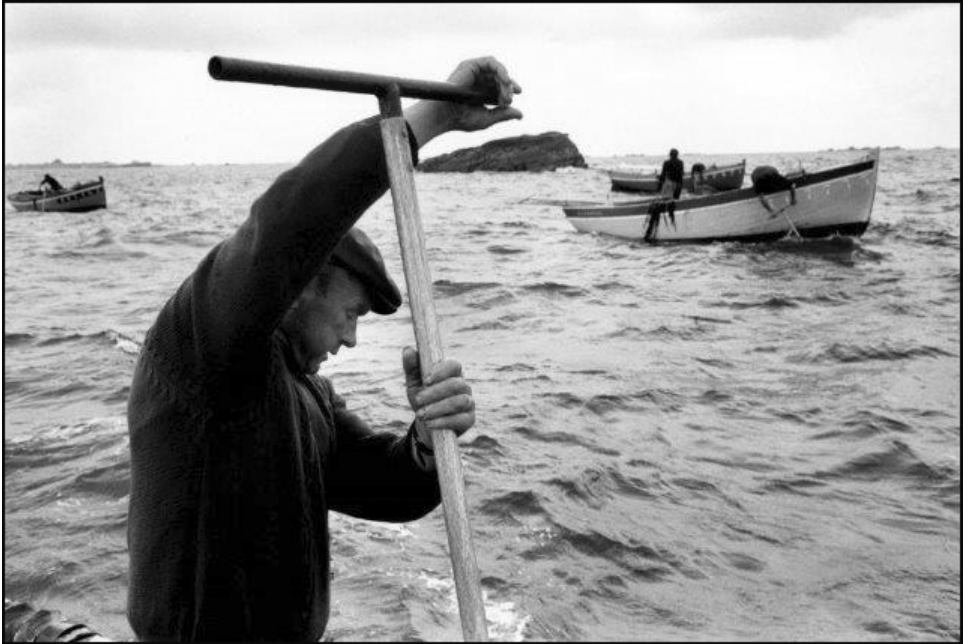
Goémonier, Bretagne, 1971