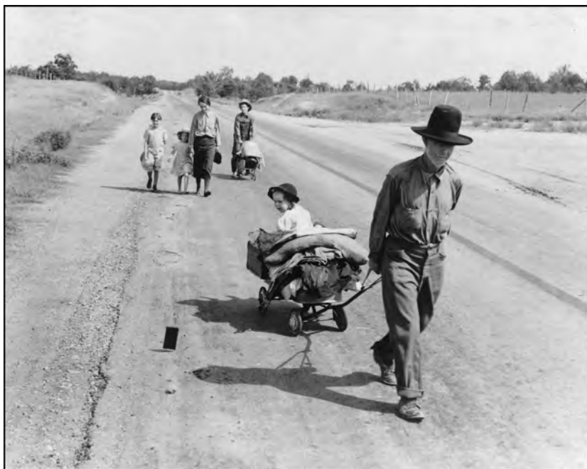
Famille avec 5 enfants marchant sur une autoroute - juin 1938