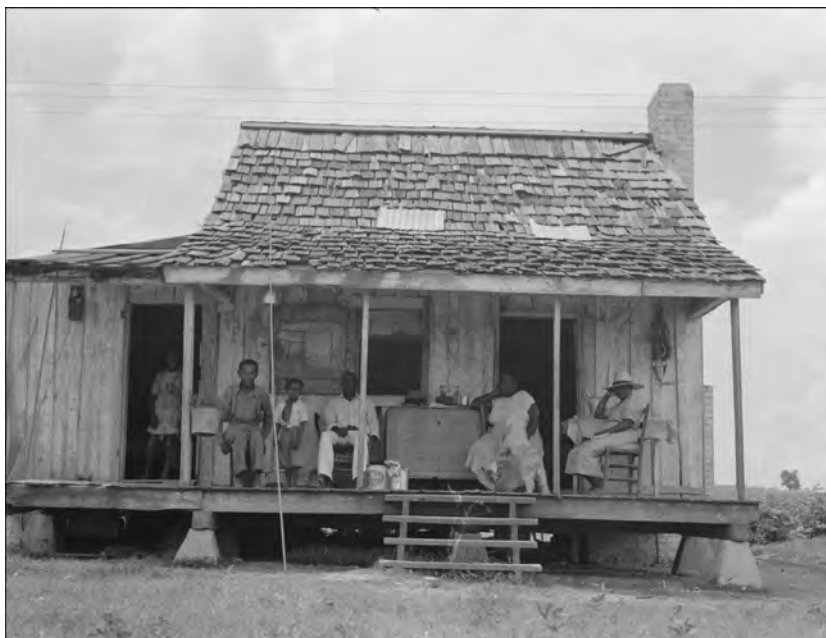
En été, un samedi après-midi dans une plantation du Delta en Arkansas - 1938