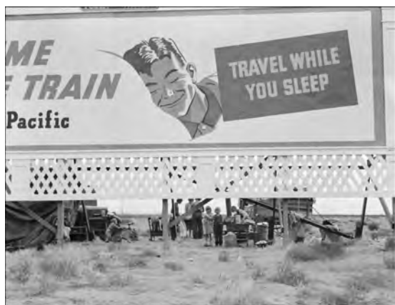
Publicité le long de la route US99. Trois familles de migrants sans ressources campent en dessous Conté Kern, Californie - 1938