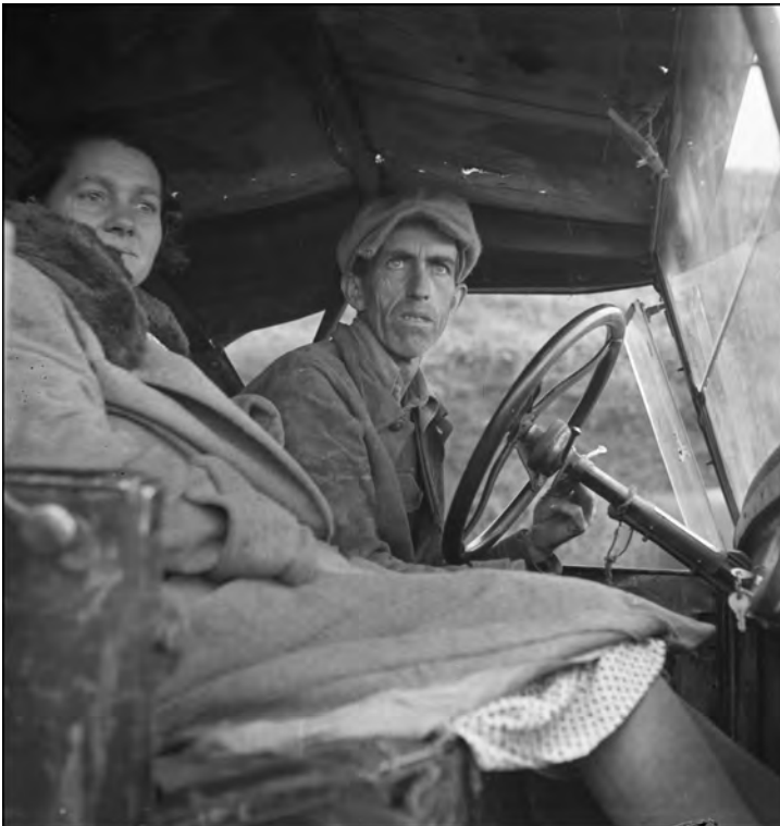
Laboureur migrant sur la côte ouest, Californie. Ancien cultivateur dans le Missouri - 1936